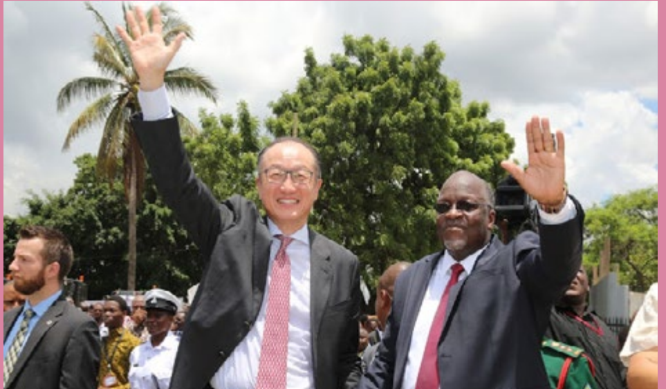
Rais wa Jamhuri ya Muungano wa Tanzania Dkt. Jophn Pombe Magufuli na Rais wa Benki ya Dunia Dkt. Jim Yong Kim wakiwaaga wananchi waliohudhuria hafla ya uwekaji wa jiwe la Msingi katika mradi wa ujenzi wa Barabara za Juu katika makutano ya Ubungo jijini Dar es Salaam.