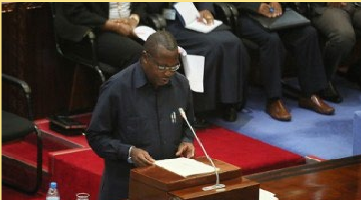
Waziri wa Fedha na Mipango, Mhe. Dkt. Philip Mpango akiwasilisha Mapendekezo ya Mpango wa Maendeleo wa Taifa na Kiwango cha Ukomo wa Bajeti kwa mwaka wa Fedha, 2017/18 ambapo imepanga kutumia Sh. Trilioni 31.6.

Zone) na tayari maandalizi ya kuweka miundombinu, hususan barabara, kwa eneo hilo yanaendelea.