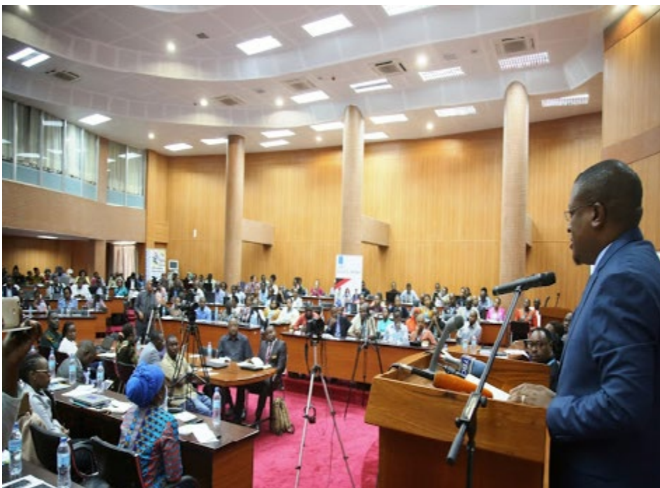
Aliyekuwa Waziri wa Habari, Utamaduni, Sanaa na Michezo Mhe. Nape Nnauye akizungumza na Maafisa Mawasiliano wa Serikali wakati akifungua kikao kazi cha 12 cha Maafisa Mawasiliano wa Serikali kinachofanyika Mkoani Dodoma.